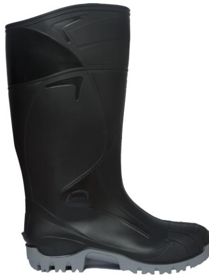
Foto lateral del calzado